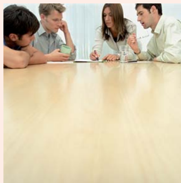
Des outils de travail communs pour les créateurs d'entreprises

Pour stimuler la dynamique économique en cette période de crise (difficultés d'accès au crédit pour les entrepreneurs, morosité ambiante et indice de confiance en berne...), les élus envisagent la création d'une pépinière d'entreprises, qui se situerait en entrée de zone.