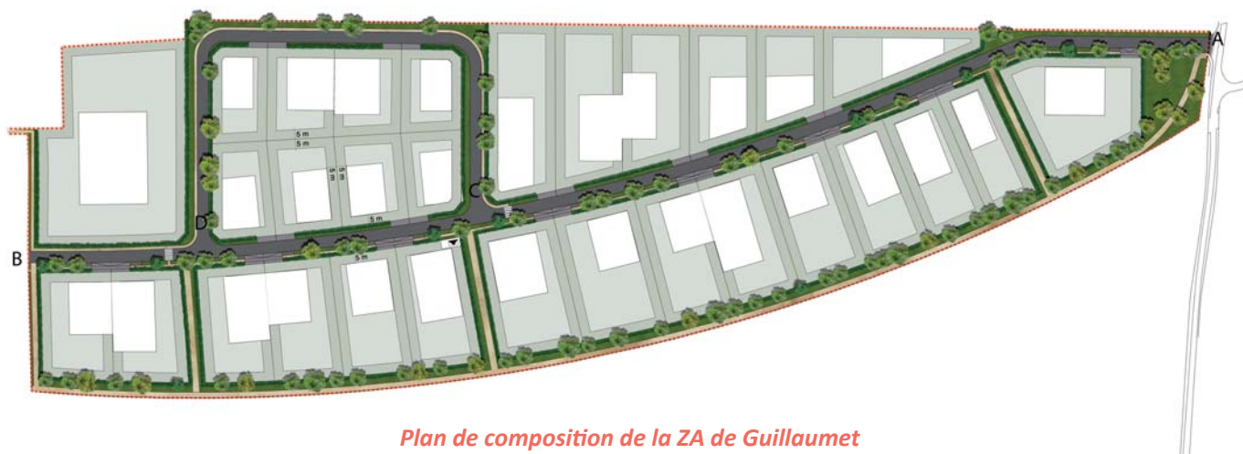
Plan de composition de la ZA de Guillaumet

Les élus communautaires font du développement économique et de l'accueil des entreprises une des priorités du territoire. Ainsi depuis quelques semaines, 9 hectares de foncier sont à la disposition d'entreprises locales ou extérieures, en situation de création ou en extension d'activité. Un terrain de 8 780 m 2 est d'ores et déjà retenu pour accueillir la nouvelle déchetterie de Grenade sur l'Adour qui sera complètement modernisée et optimisera le confort d'utilisation des administrés.