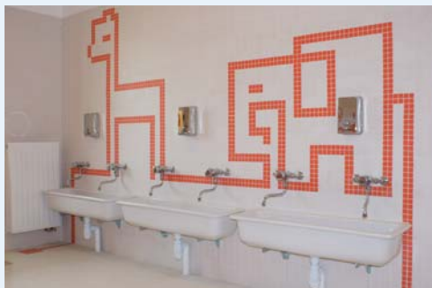
Des sanitaires ludiques propices au développement de l'imaginaire.

Nous avons, dans les sanitaires, dessiné des personnages, des fleurs, des girafes, des gorilles, et d'autres encore, signes d'identification par l'enfant, de repères, de support à des histoires personnelles que chaque enfant pourra développer par son imaginaire propre.