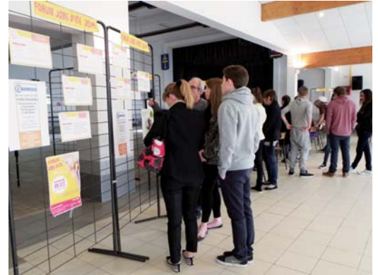
L'édition 2014 du Forum des jobs d'été a accueilli une centaine de jeunes

Pour les retardataires, il est encore possible de se rendre au Point Information Jeunesse ou au Point Relais Emploi qui accueillent et orientent, tout au long de l'année, les jeunes en recherche d'emploi ou de stage. Contacts : 05 58 03 79 02 pour le PIJ et 05 58 45 44 42 pour le Point Relais Emploi.