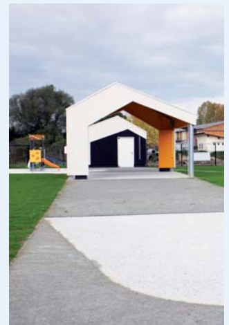
Des formes dyssymétriques qui s'encastrent parfaitement.

Nous avons essayé, dans ces grands espaces, de permettre l'existence de coins et recoins pour permettre le repli, par l'échelle, à l'aide des changements de couleur des sols, des abaissements de plafonds, pour s'isoler parmi le collectif, une des conditions à l'imaginaire. Nous avons toujours eu à l'esprit l'enfant, son développement, son éveil, son respect.